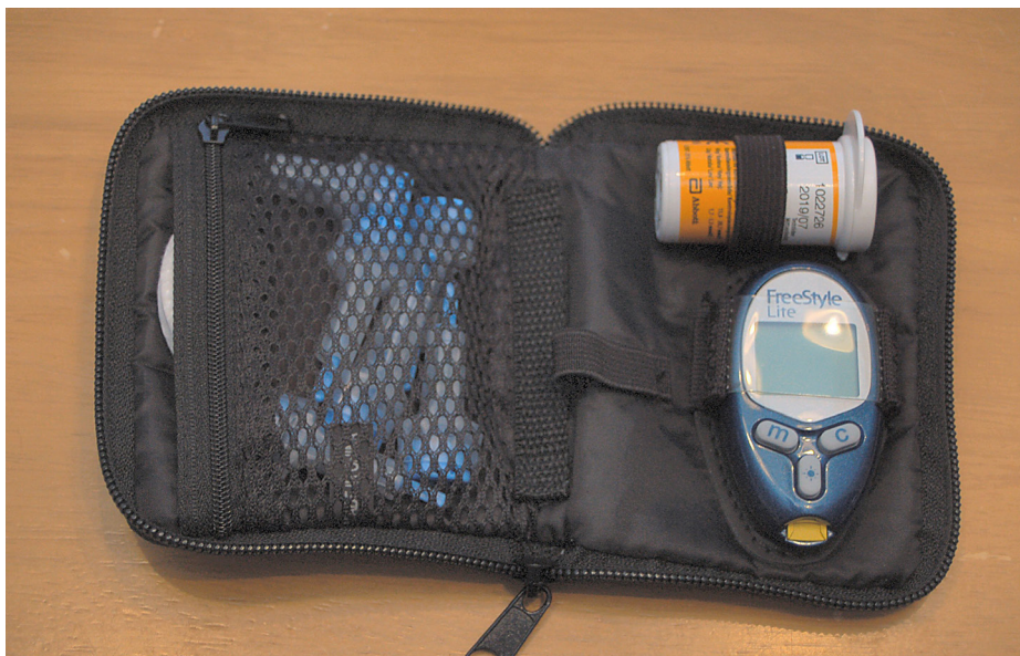
Blodsockermätare med en burk provstickor.

betes även om det inte är lika vanligt. Typ 1-diabetes kan drabba vem som helst, man vet egentligen ingenting om orsaker eller samband men det forskas mycket om det både i Sverige och utomlands.