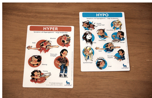
Snabbkort som visar olika symtom vid för högt eller för lågt blodsocker.

Ja, och att känna igen symtomen hur för låg eller för hög blodsockernivå visar sig. Därför får alla diabetiker och föräldrar med barn som har diabetes mycket utbildning och råd och stöd. Personalen på diabetesteamet bedriver även förebyggande arbete genom att till exempel utbilda personal på skolor och förskolor. Man har även dagvårdsbehandling.