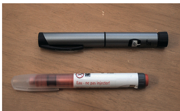
Insulinpennor, den grå med utbytbar insulin-ampull. Den vita är en engångspenna som kasseras efter användning.

Typ 1-diabetes kallades förr ofta för barndiabetes eftersom det oftast var barn och ungdomar som drabbades av det, men även vuxna får typ 1-dia-